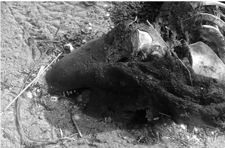
Fig. 3. Presunto globicefalo spiaggiaio presso Scanno Cavallari (19 ottobre 2006).