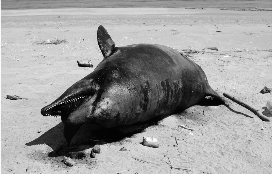
Fig. 2. Tursiopo spiaggiaio presso lo Scanno di Boccasette (foto D. Trombin, 2 maggio 2009).