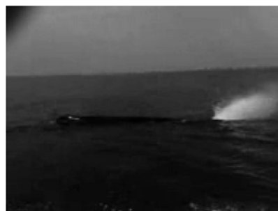
Fig. 4. a) Due indd. di tursiope contattati da un pescatore sportivo durante l'estate del 2008 al largo di Porto Levante; b) capodoglio avvistato a circa 1 miglio marino dalla costa del Delta del Po il 31 marzo 2008 presso l'isola di Albarella.

Le segnalazioni relative a cetacei vivi sono in numero inferiore rispetto a quelli spiaggiati, ma si riferiscono a un maggior numero di individui (tab. 2). In questo caso è stato molto più difficile attribuire correttamente la specie, operazione possibile solo nel caso di avvistamenti accompagnati da foto o da filmati. Le specie rilevate con certezza sono due, tursiope ( Tursiops truncatus , fig. 4a) e capodoglio ( Physeter macrocephalus , fig. 4b); molto alto è il numero degli avvistamenti e degli individui non determinati.