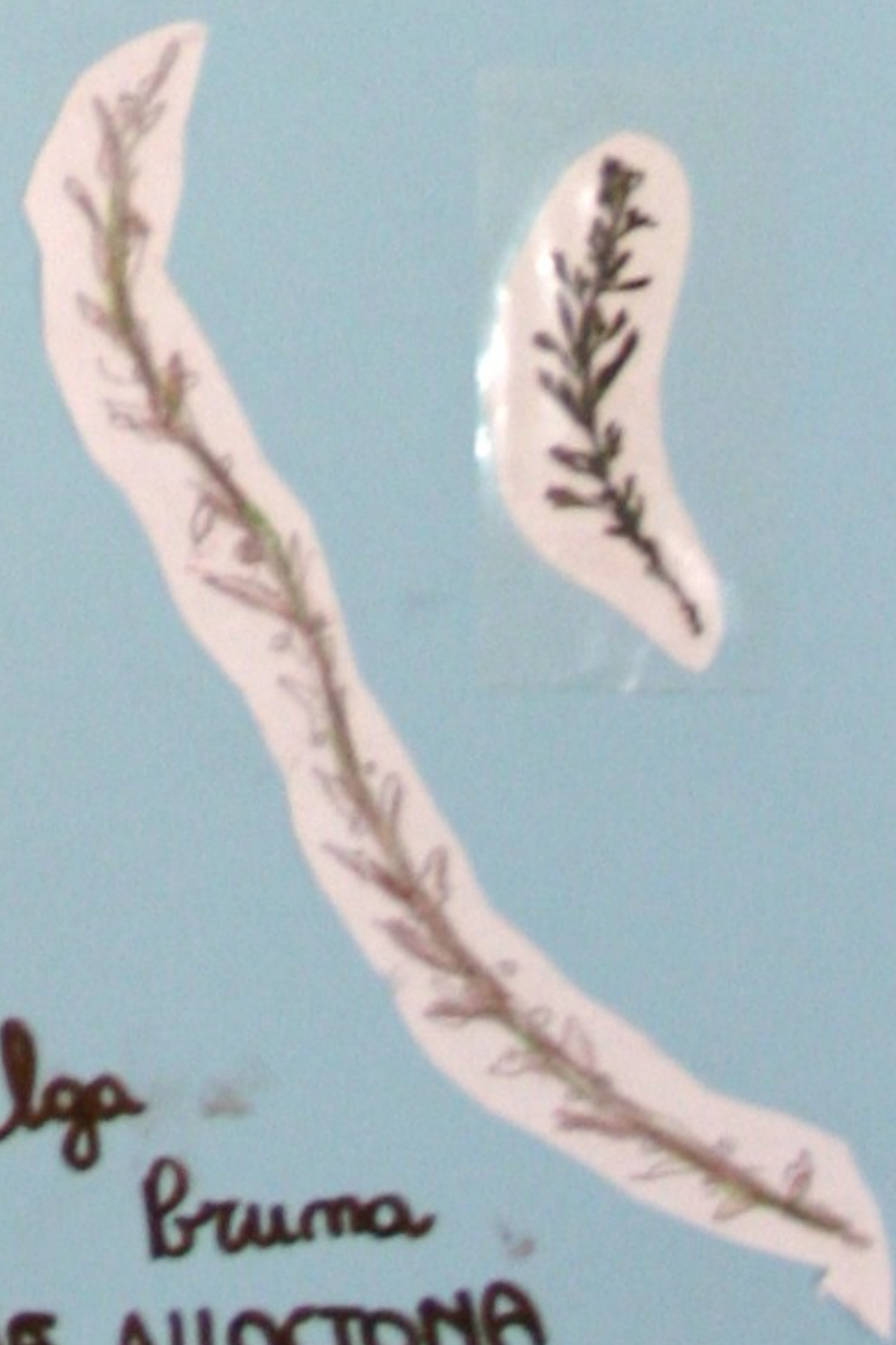
Alga Bruna SPECIE ALLOCTONA