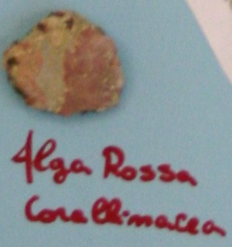
Alga Rossa Corallimacha